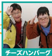
チーズハンバーグ